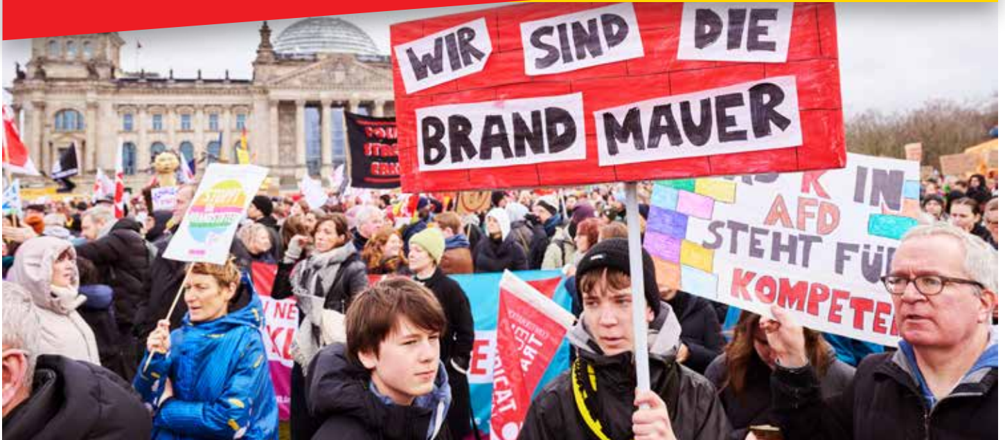
Massenhaft neu belebt: „Wir sind die Brandmauer“ (Demonstration in Berlin vom Januar 2024)

Faschistische Gefahr verschärft sich akut – Millionenfache Brandmauer muss gestärkt werden!