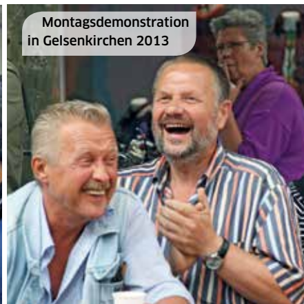
Montagsdemonstration in Gelsenkirchen 2013