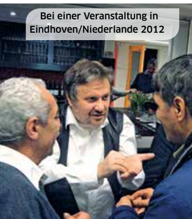
Bei einer Veranstaltung in Eindhoven/Niederlande 2012