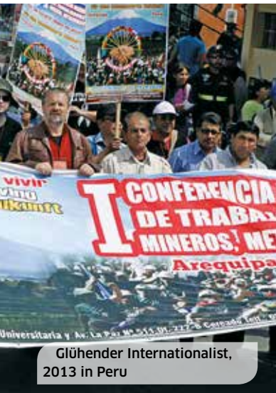
Glühender Internationalist, 2013 in Peru